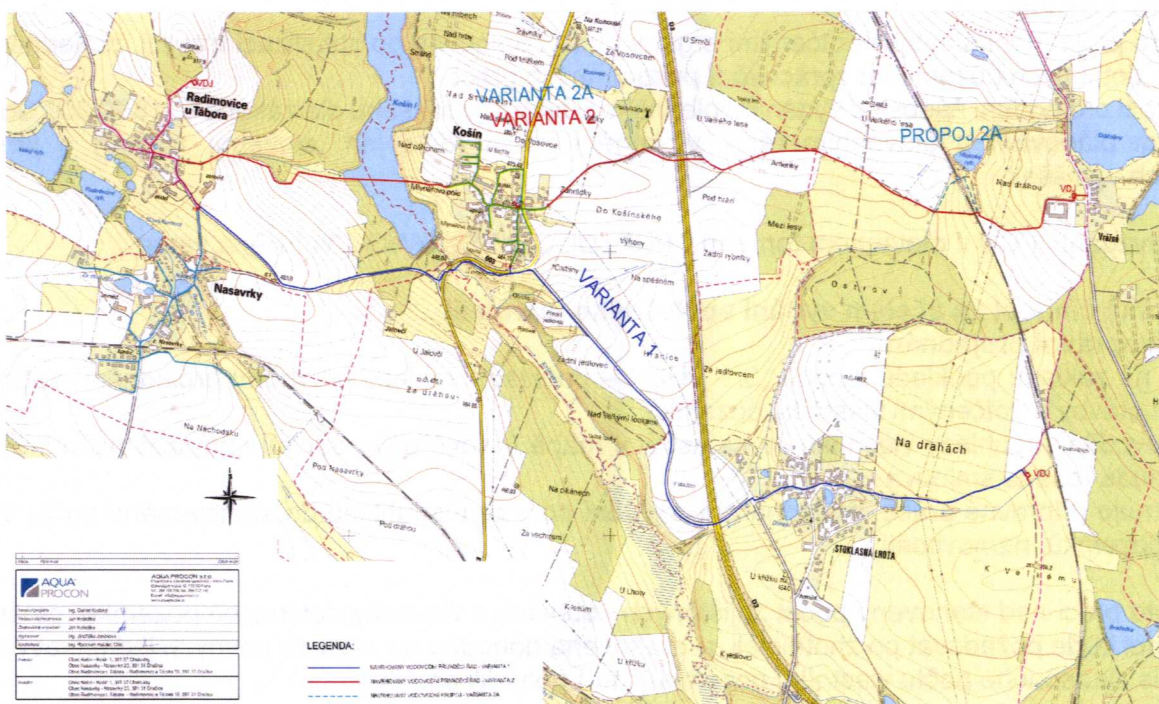
Obr. Situace ze studie – zpracování varianty č.1, varianty č.2 a 2 A