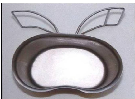
vzorová fotografie č. 7