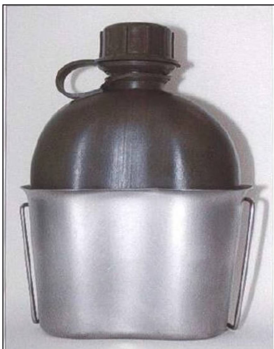
vzorová fotografie č. 1