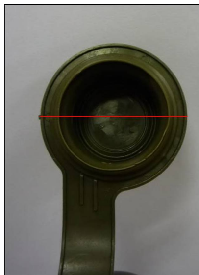
vzorová fotografie č. 6