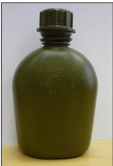
vzorová fotografie č. 3