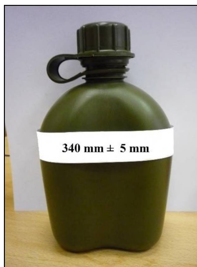
vzorová fotografie č. 4