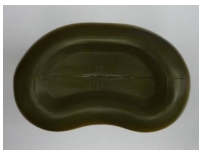
vzorová fotografie č. 5