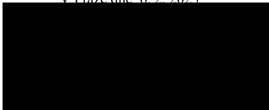
D & D Logix s.r.o.