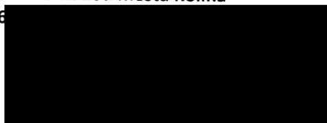
Michal Najbrt II. místostarosta města Kolína