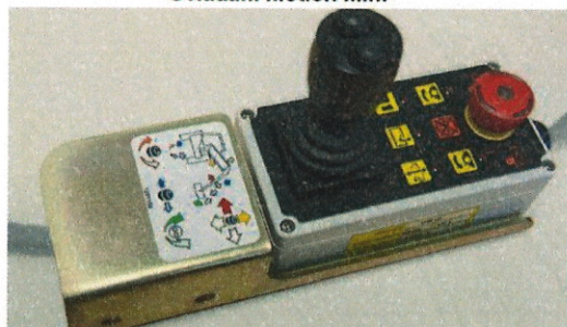
Ovládání Motion Mini