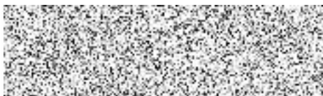
Sodexo Pass Česká republika a.s. zastoupeno: Ivou Vonšíkovou