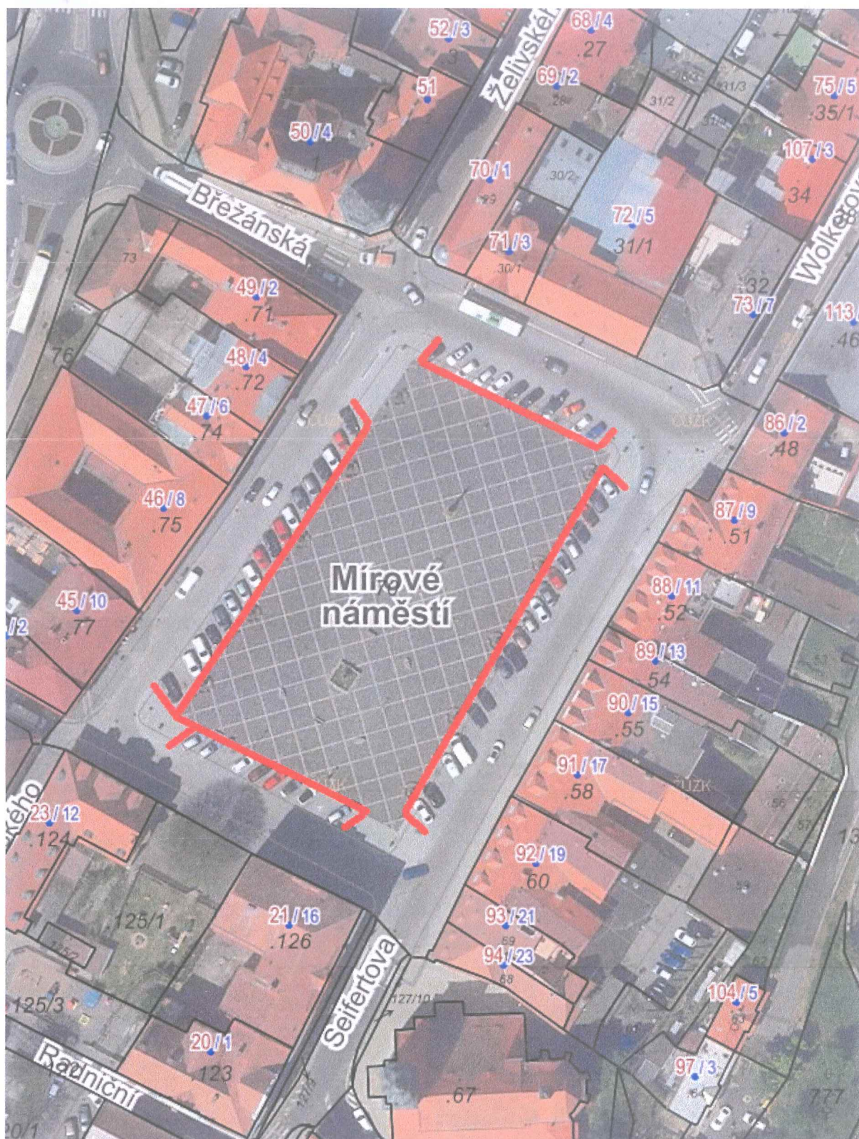
Příloha č. 1 – vyznačení parkovacích ploch