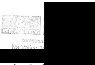
vedoucí pobočky Louny