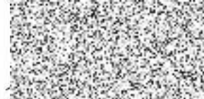
člen statutárního orgánu