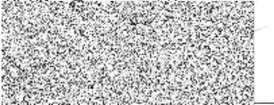
CETIN a.s. Martin sokol