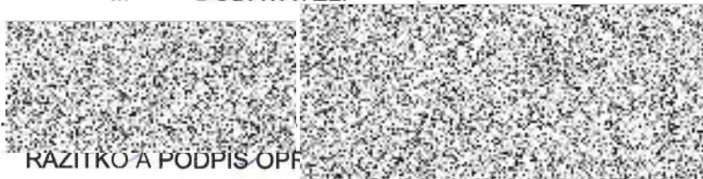
RAZÍTKO A PODPIS OPF ZÁSTUPCE DODAVATELE