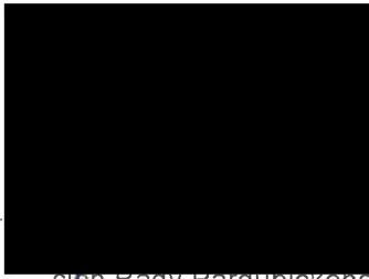
..... člen Rady Pardubického kraje