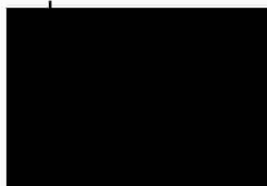
Boris Šlosar manažer specializovaného útvaru implementace transform. SPS