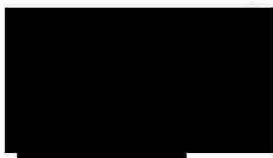
Boris Šlosar manažer specializovaného útvaru implementace transform. SPS