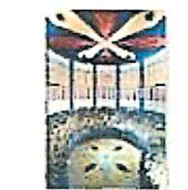
30 VOLAREZA Bedřichov parní solná sauna