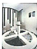
34 VOLAREZA Bedřichov Kneippův chodník.jpg