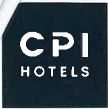
Exhibit B pro firmu DIAMO, státní podnik – Ceny pro rok 2023

Platné pro období 02/01/2023 - 28/12/2023