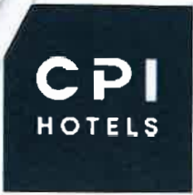
Exhibit B pro firmu DIAMO, státní podnik – Ceny pro rok 2023 Platné pro období 02/01/2023 - 28/12/2023