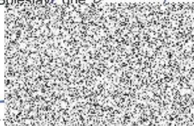
MUDr. Raduan Nwelati primátor statutární město Mladá Boleslav