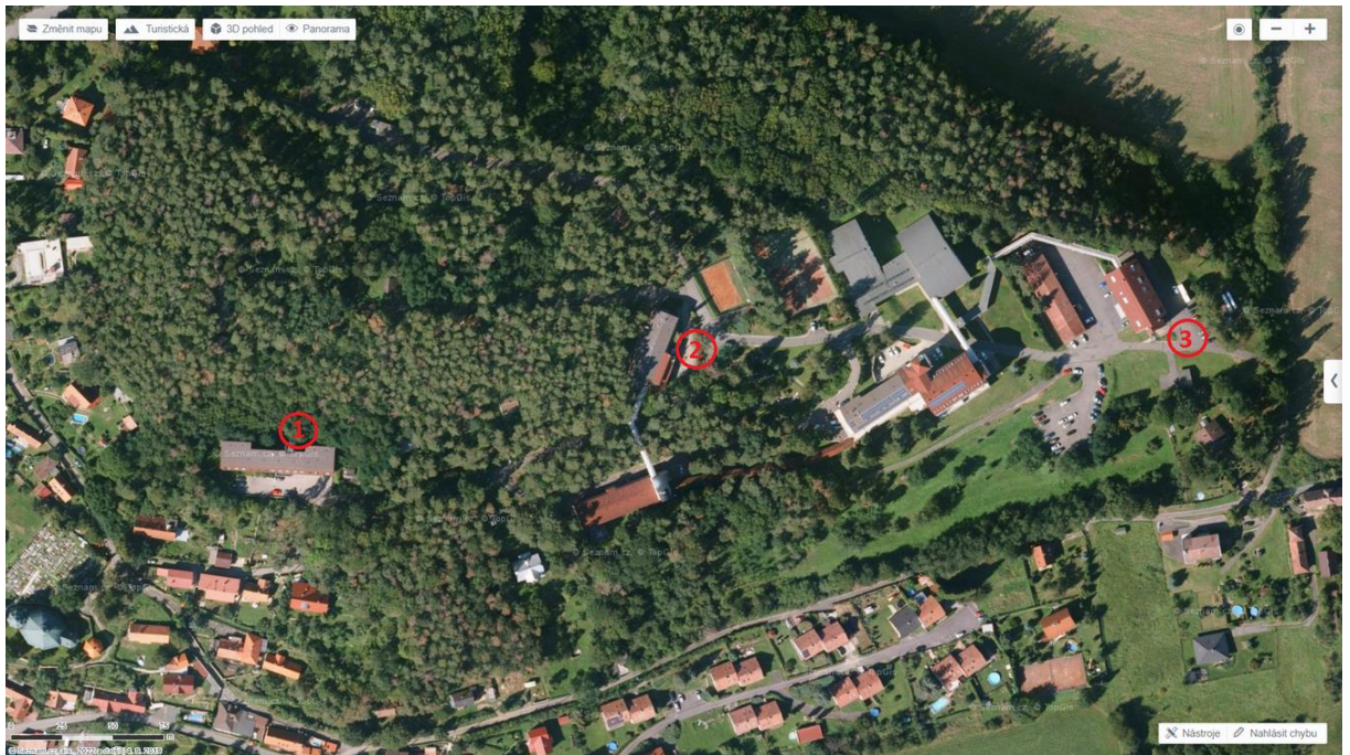
Obr. 2 Dotčené budovy „VRÚ Slapy – FVE“