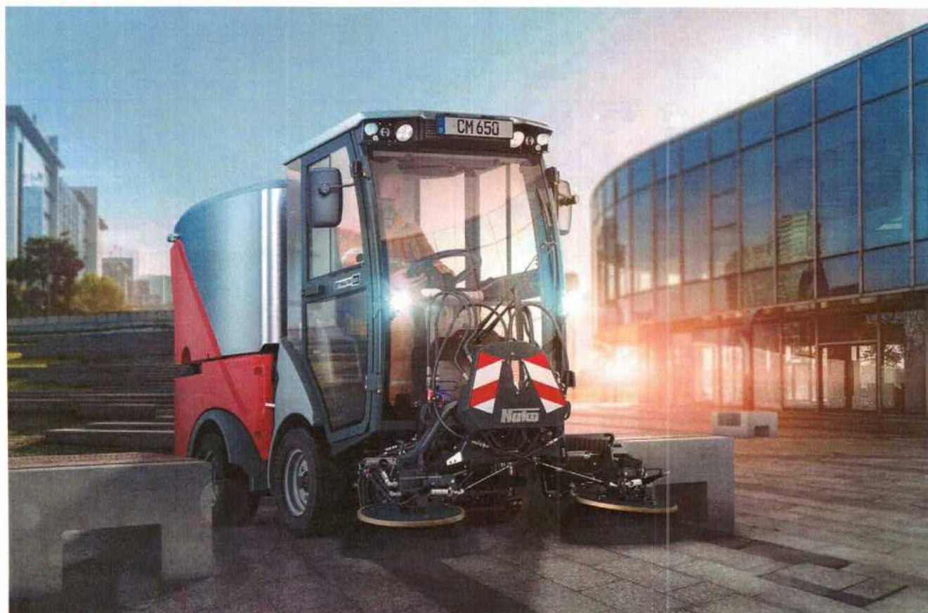
Ilustrativní vyobrazení – profesionální zmetací stroj HAKO Citymaster 650.