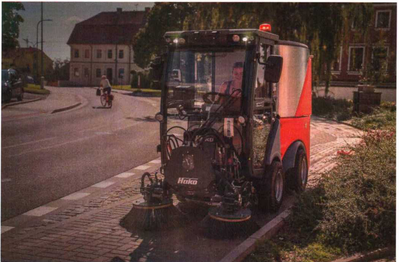
Ilustrativní vyobrazení – profesionální zametací stroj HAKO Citymaster 650 s přední dvoukartáčovou zametací jednotkou.

Navrhují profesionální zametací stroj nejmodernější koncepce, HAKO Citymaster 650 se stálým pohonem všech kol 4x4. Tento model vyniká velice kompaktními rozměry (šíře na standardních pneu 109 cm) a obratností (kloubové provedení). Stroj je koncipován jako multifunkční s možností celoročního využití (letní a zimní režim provozu).