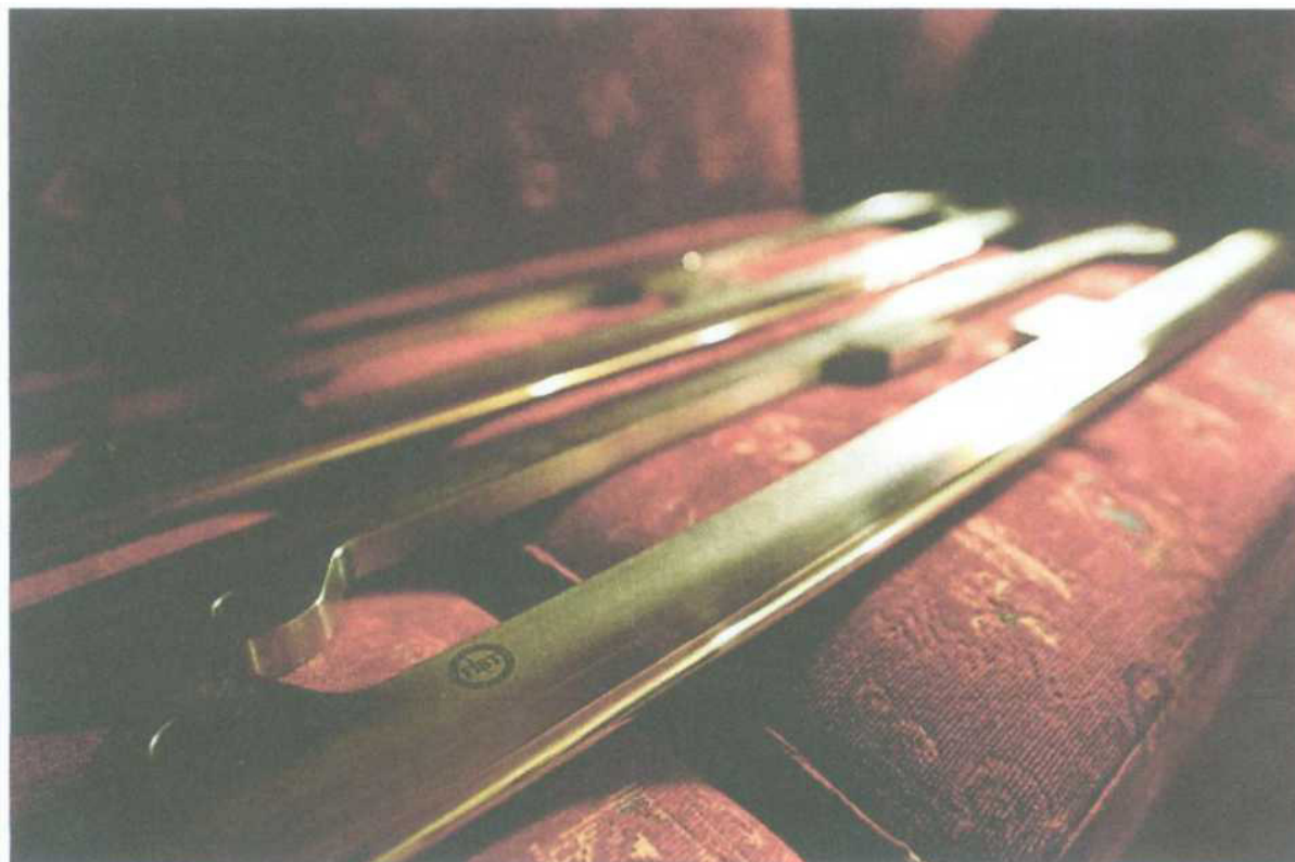
Obr. 1 – Závodní nože pro boby

Nože pro závodní boby jsou vyráběny ze speciální slitiny oceli, která je obrobená dle technických parametrů (viz. obr. 2), předepsaných mezinárodní federací IBSF.