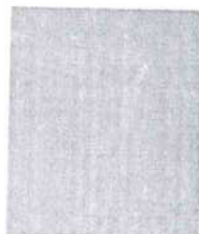
R 5320 buk přírodní