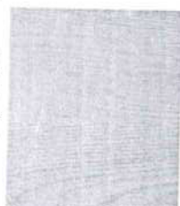
R 4223 dub Lindberg