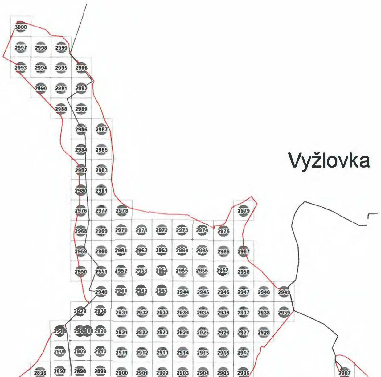
Obr. Ukázka detailu rozmístění 3000 měřících bodů (souřadnice budou dodány ve formátu Arc Gis)