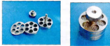
Standardní držáky vzorků pro K850