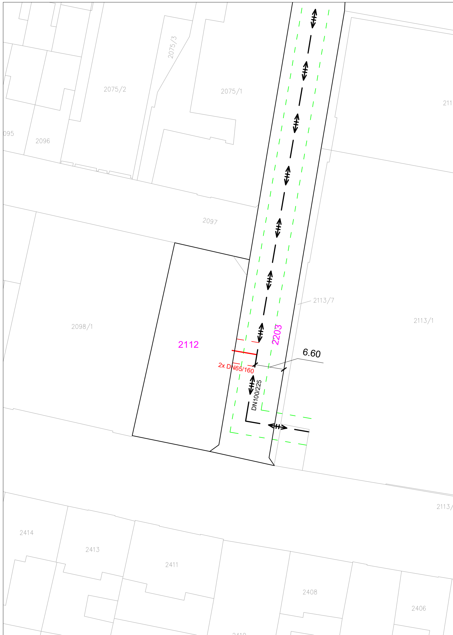
TABULKA DOTČENÝCH POZEMKŮ V K.Ú. TÁBOR: