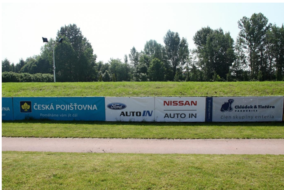
PŘÍLOHA č. 4 - umístění reklamního banneru o rozměru 8x1 m na plotě dostihového závodiště v ulici Pražská