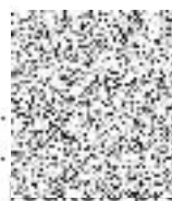
plk. RNDr. .... ředitel náměstek ..... ekonomiku