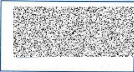
Podpis příp. razítko zástupce pojistitele / Signature or stamp of the insurer's representative

Číslo zástupce pojistitele / Insurer's representative number: 03000262 Číslo sjednatele / Insurer's partner number: 03000262