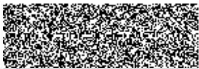
plk. Ing. František Mencel ředitel HZS Královéhradeckého kraje

Česká republika Hasičský záchranný sbor Královéhradeckého kraje nábytež U Pířvozu 122/4 500 03 Hradec Králové IČ: 70 88 25 25 CZ-NUTS: CZ0521 (42)