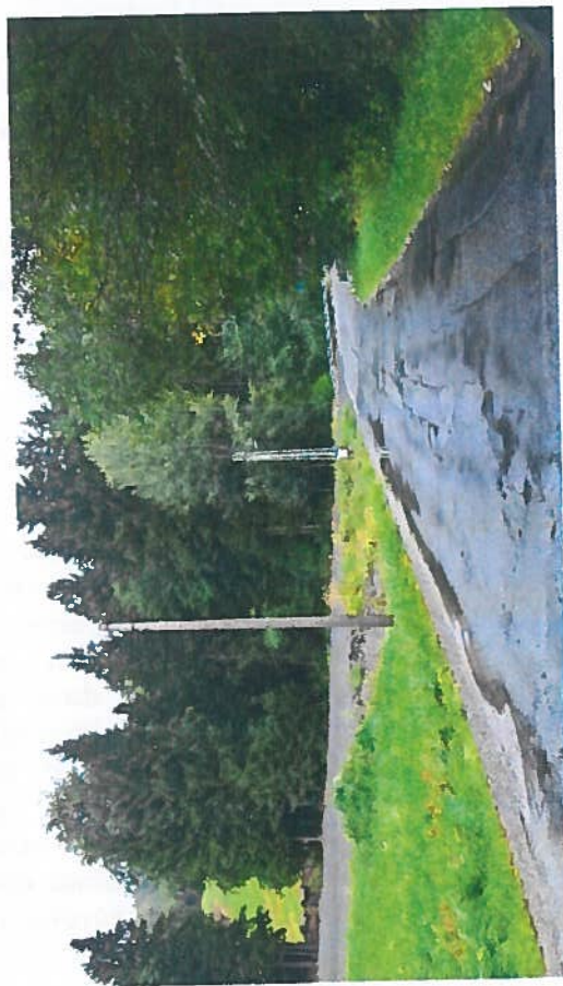
Silnice III/28741 a III/28743 Huť – Zásada, rekonstrukce silnice