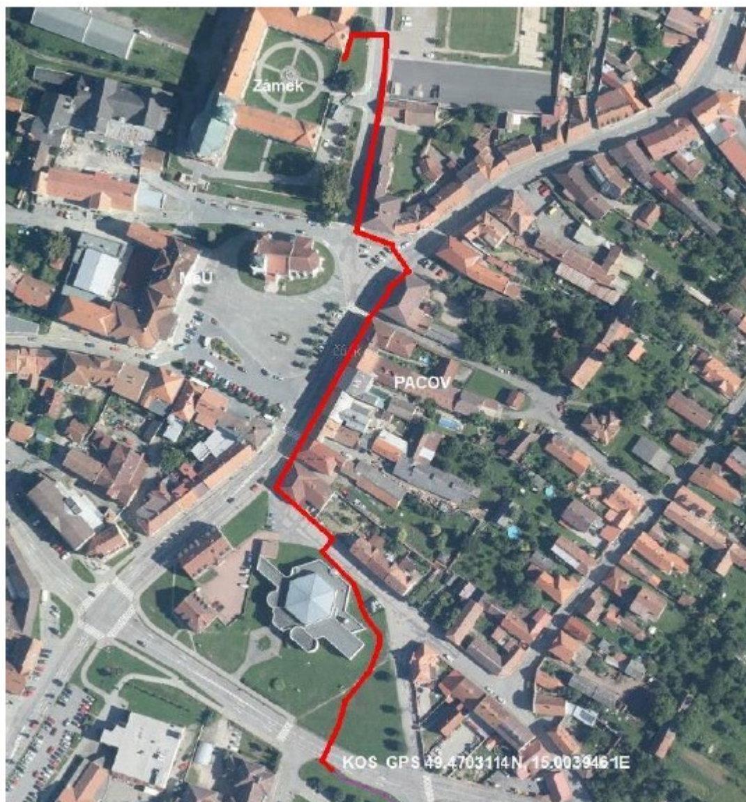
rozvaděč 1U MěÚ serverovna zámek

situace v mapě + předpokládané ukončení trasy v serverovně a datovém rozvaděči níže: