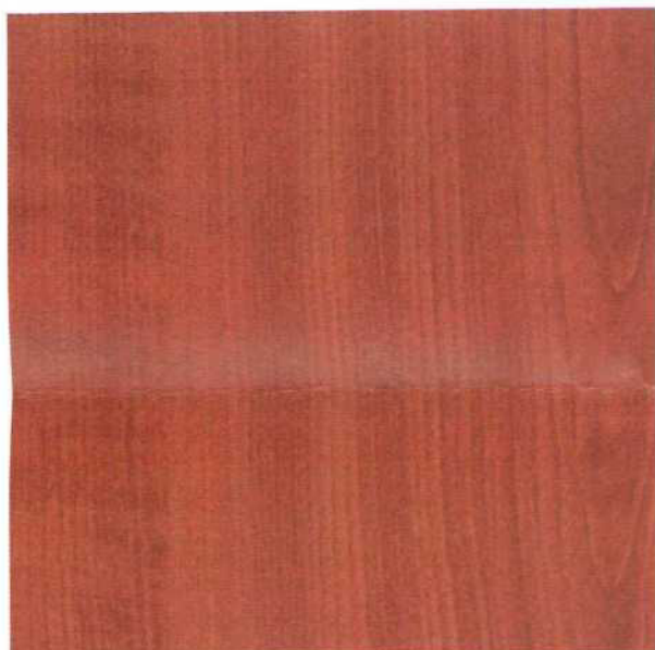
KRONOSPAN 344 třešeň