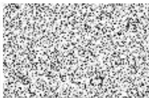
ČEZ Teplárenská, a.s.