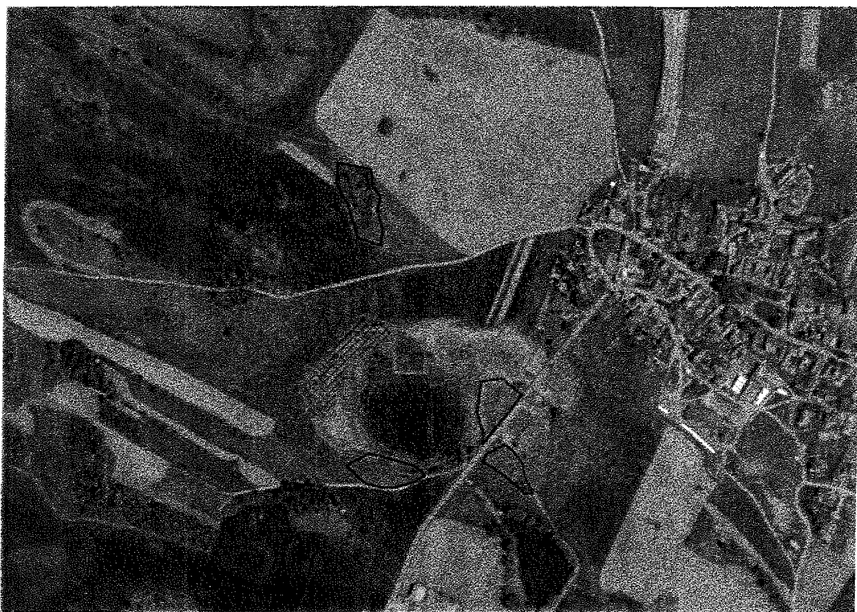
červeně – pastva ovcí v oplůtku modře – stržení drnu v. litorálu rybníka oranžově – kosení břehových porostů