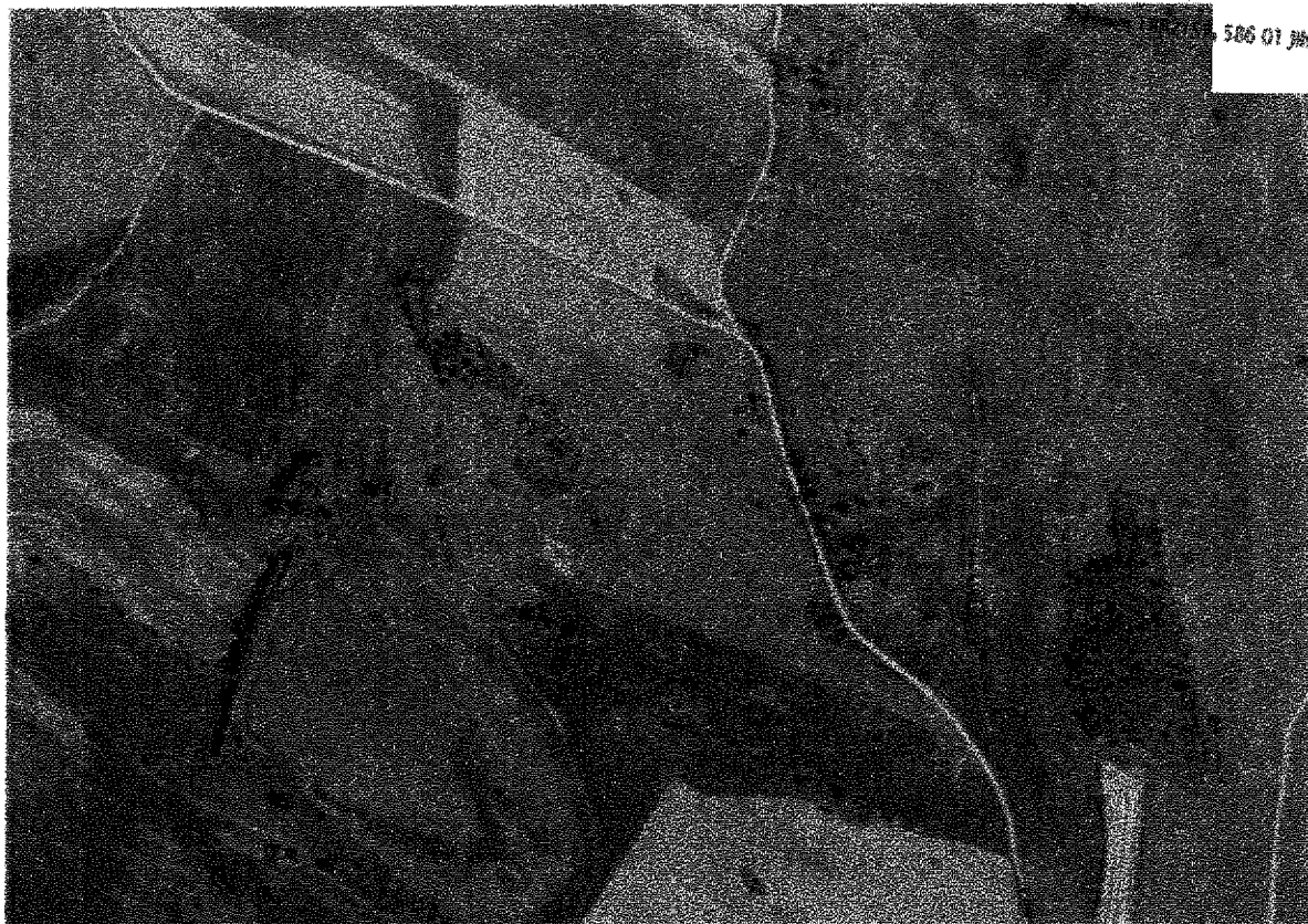
oranžově – kosení výmladků janovce