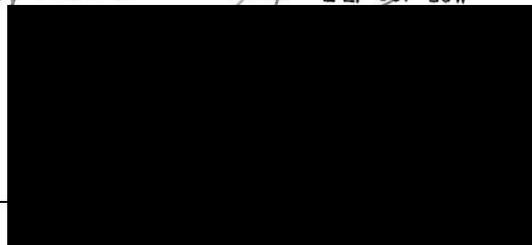
vykonný reditel „zhotovitel“

SPOLEČNOST PRO ZACHOVÁNÍ KULTURNÍHO DĚDICTVÍ HISTORIE A ROMANTIKY Slezskoostravský hrad, ul. Hradní, 710 00 Slezská Ostrava ičo: 27030261 tel: +420 603 164 629 www.historie-romantika.cz info@historie-romantika.cz