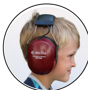
Noise cancellation Headset