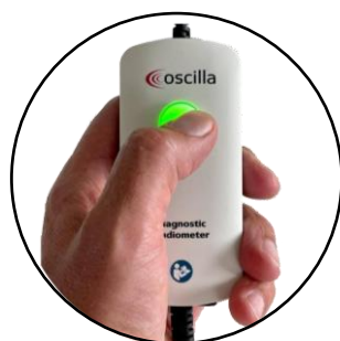
Lightning button feedback