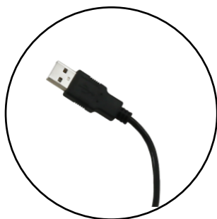
Plug & play via USB

Oscilla AudioConsole provides you with a user-friendly interface for audiometry and data management. Watch audiograms update in realtime on your screen, show the results to your patient, save them in the database, generate customised PDF reports or export the results to your patient management system.