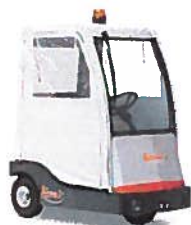
Kabina + PVC látkové dveře