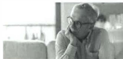
Narušená komunikační schopnost