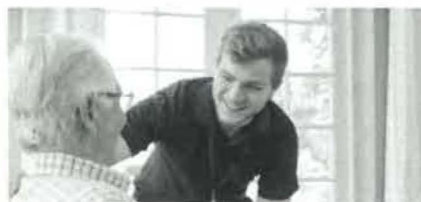
Celodenní péče na krátký čas