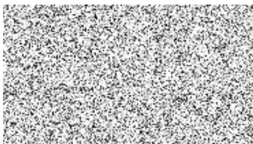
ředitel Letecké služby PČR