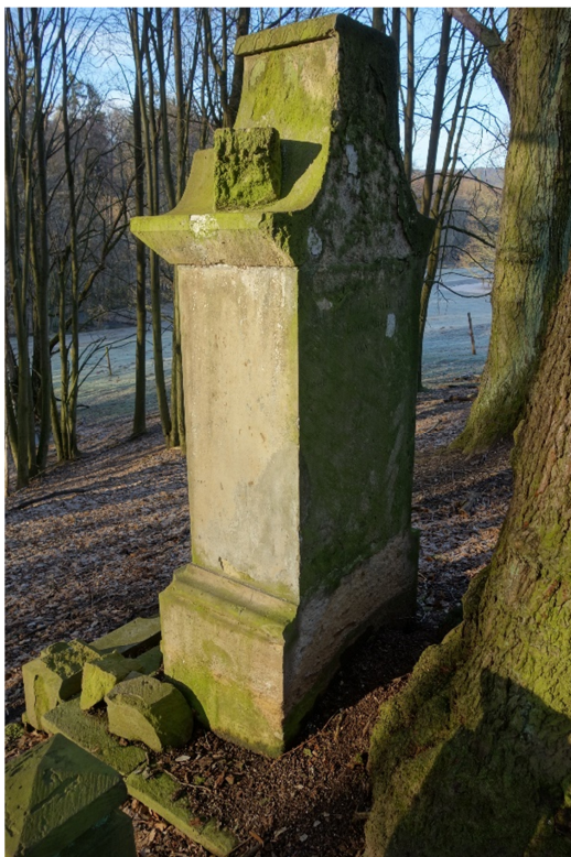
Obr. 3: Pohled levo – zadní. Stav 24.2.2022.