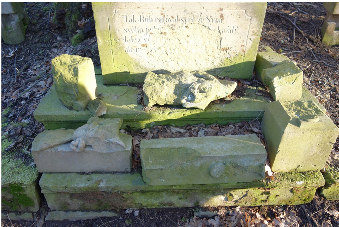
Obr. 4: Pohled na fragmenty kříže. Stav 24.2.2022.