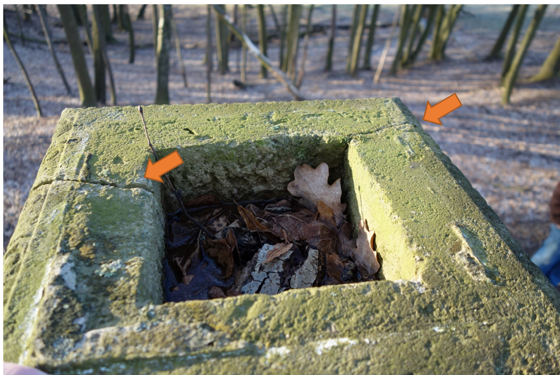
Obr. 6: Detail hlavice svrchu. Patrné praskliny po stranách. Stav 24.2.2022.