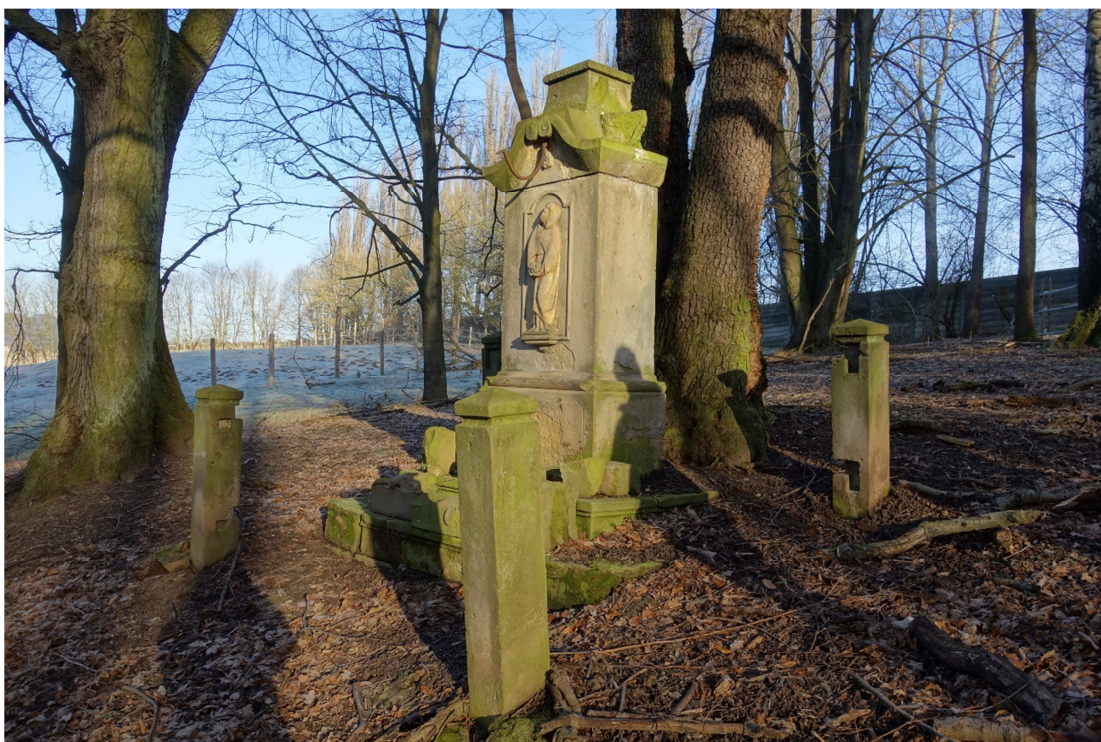
Obr. 2: Celkový pohled levo - přední. Stav 24.2.2022.