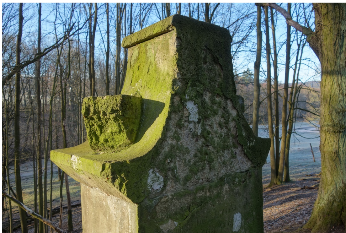
Obr. 5: Detailní pohled na zadní zerodovanou plochu hlavice. Stav 24.2.2022.