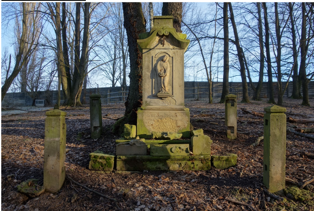
Obr. 1: Celkový pohled na Křížek zepředu. Stav 24.2.2022.