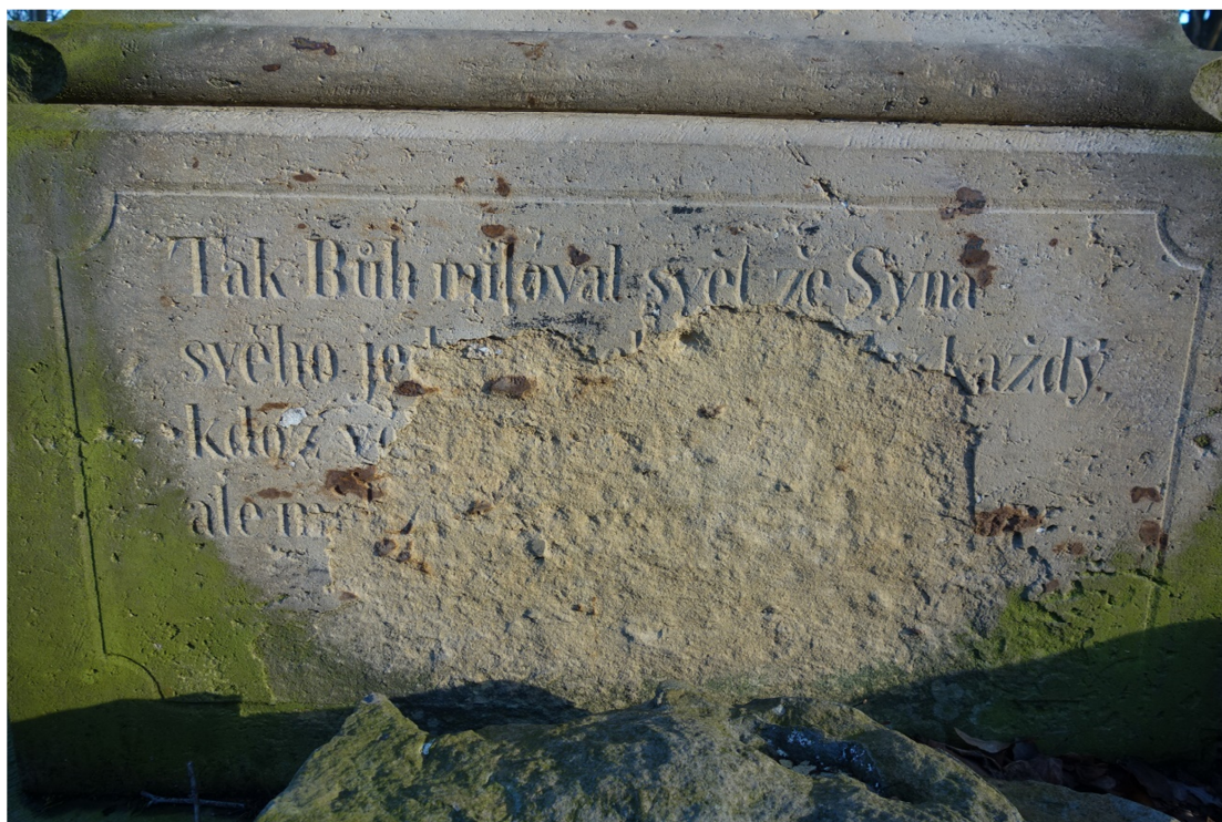
Obr. 7: Detailní pohled na zerodovaný text v čelní ploše podstavce. Stav 24.2.2022.