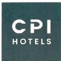
Exhibit B pro firmu Centrum kultury a vzdělávání – Ceny pro rok 2023

Platné pro období 02/01/2023 - 28/12/2023