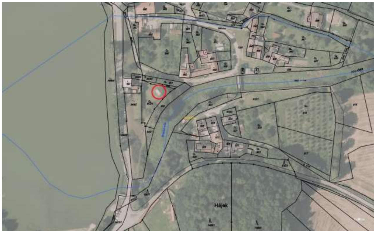
Umístění kontejneru v profilu SP4 - IDVT 10198247 u ČOV Krumsín