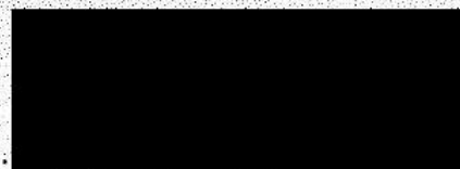
Ladislav Okleštěk hejtman