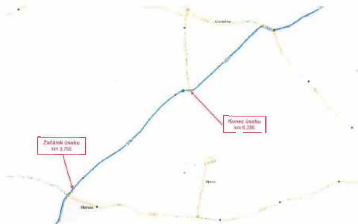
Silnice II/308 Slatina – Čermilov, SO 101.1