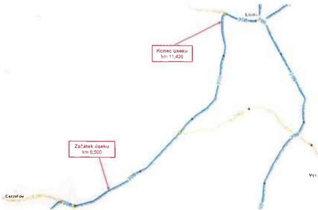
Silnice IV/308 Černilov - Libřice SO 101.3