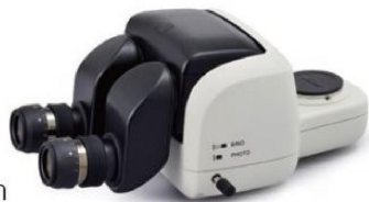
P-TERG100 Trinocular Tilting Tube

Allows continuous adjustment of the eyepiece inclination from 0° to 30°. Optical path switching ratio of eyepiece:camera port is 100:0/0:100 with P-TERG100 and 100:0/50:50 with P-TERG50.