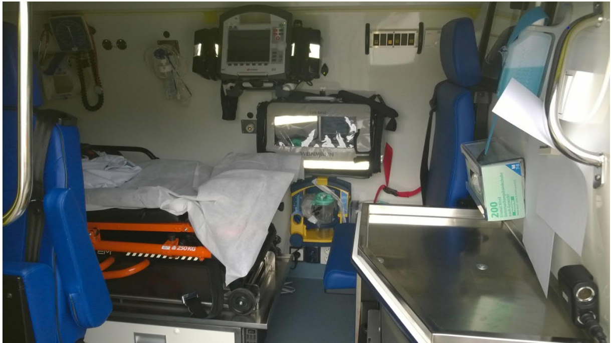
ilustrační fotografie č. 1