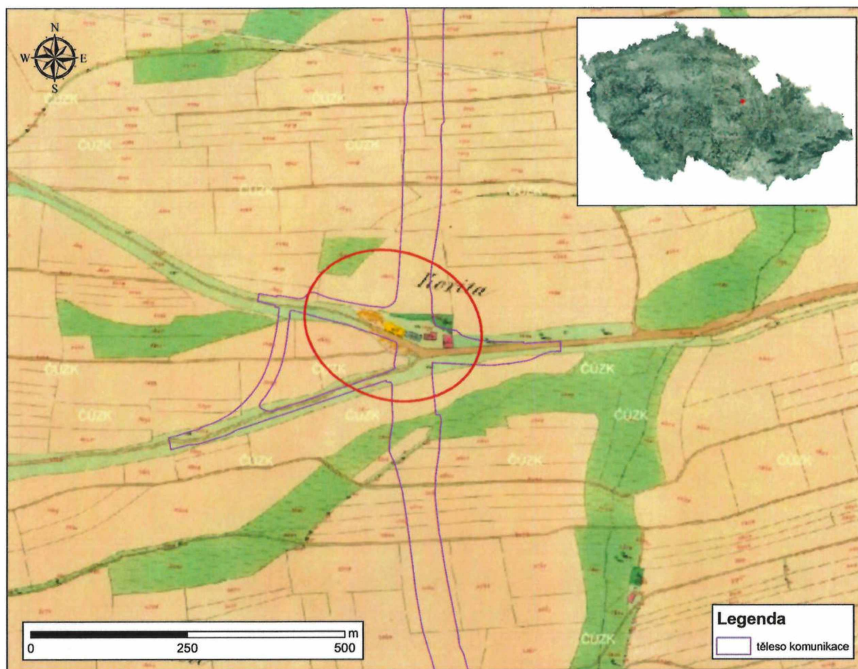
Obrázek 5: Zákres výseče georeferencovaného tělesa komunikace s vyznačením archeologických lokalit v mapovém podkladu tzv. Císařského povinného otisku stabilního katastru (M 1: 2880, mapováno r. 1839). V červeném kruhu vyznačen dnes již neexistující objekt cihelny (lokalita č. 21)