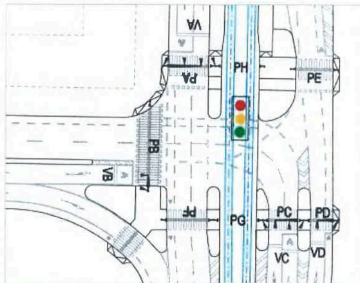
Obr. 1 – Navrhovaná úprava

Objednavatel předal předběžné kapacitní výpočty pro nově navrhovanou úpravu křižovatky Hlávkův most x rampa na nábřeží kp. Jaroše.