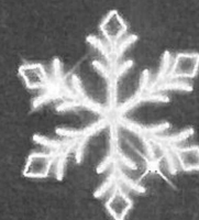
LED dekor A22 114 x 97 cm, 58 W