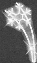
LED dekor A7 172 x 82 cm, 58 W