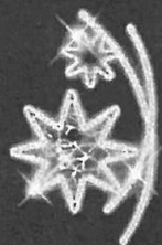
LED dekor AV-2 v. 133 x s. 81 cm, 63 W