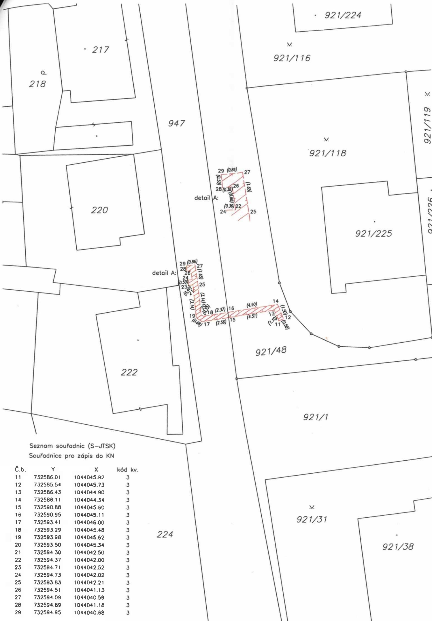
Seznam souřadnic (S-JTSK) Souřadnice pro zápis do KN