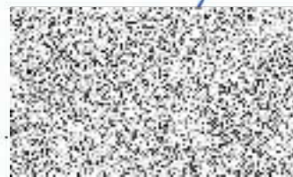
brig. gen. Ing. Miloslav Svatoš ředitel HZS Středočeského kraje vrchní rada

Česká republika Hasičský záchranný sbor Středočeského kraje Jana Palacha 1970 272 01 Kladno 2